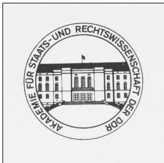
Das ehemalige DRK-Präsidialgebäude im Signet der Akademie für Staats- und Rechtswissenschaften der DDR

schob sich der Schwerpunkt der Akademie auf die Ausbildung staatlicher „Auslandskaader“. Nach der Entmachtung Ulbrichts durch Erich Honecker Anfang der 70er Jahre verlor die Akademie im Jahre 1973 auch dessen Namen und firmierte künftig unter der Bezeichnung „Akademie für Staats- und Rechtswissenschaften der DDR“.