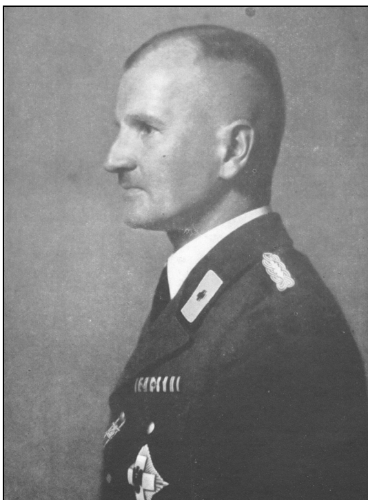
Ernst-Robert Grawitz, Reichsarzt-SS und seit 1938 Geschäftsführender Präsident des DRK

Grawitz war gleichzeitig „Reichsarzt-SS“ und in dieser Funktion verantwortlich für alle medizinischen und sanitätstechnischen Belange der Schutzstaffel (SS), zu denen auch die Konzentrationslager gehörten. Seit Anfang der 40er Jahre trug er mit die Hauptverantwortung für die brutalen medizinischen Versuche der SS-Ärzte an KZ-Häftlingen. An diesen Versuchen waren im Rahmen ihrer SS-Mitgliedschaft auch DRK-Ärzte beteiligt.