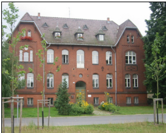
Das ehemalige Verwaltungsgebäude des DRK-Zentraldepots in Neubabelsberg, heute Sitz einiger wirtschaftswissenschaftlicher Professuren der Universität.

Am Rande der ehemaligen Villenkolonie Neubabelsberg, unmittelbar südlich des heutigen S-Bahnhofes Griebnitzsee, liegt in einem Waldgelände der größte Teil des Universitätsgeländes Potsdam-Babelsberg. An der August-Bebel-Straße haben seit 1991 die Juristische sowie die Wirtschafts- und Sozialwissenschaftliche Fakultät ihren Hauptsitz. In der Historie dieses Geländes, das vor allem durch seine anfängliche Nutzung durch das Deutsche Rote Kreuz geprägt wurde, dokumentiert sich anschaulich die wechselvolle deutsche Geschichte des 20. Jahrhunderts.