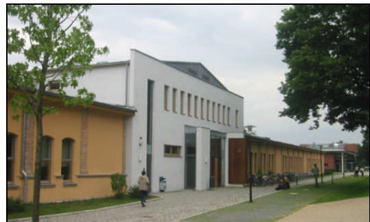
Das ehemalige Bekleidungslager des DRK-Hauptlagers, heute Sitz der Universitätsbibliothek.

fektions- und einem Stallgebäude. Diese Bauten sind teilweise heute noch erhalten und werden von einigen Professuren der Wirtschafts- und Sozialwissenschaftlichen Fakultät der Universität Potsdam als Bürogebäude und von der Universitätsbibliothek genutzt.