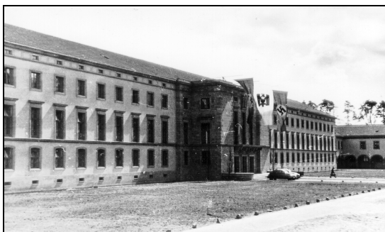
Das fertiggestellte DRK-Präsidialgebäude im April des Jahres 1943

Nachdem Ende 1938 der Lageplan für das künftige Babelsberger Stadt- und Kulturzentrum festgelegt worden war, konnten die ersten Arbeiten für das DRK-Präsidialgebäude beginnen, und bereits im Januar 1939 wurde der Grundstein gelegt. Genau vier Jahre später, im Januar 1943, war der Bau so weit fertiggestellt, dass die Arbeitsräume bezogen werden konnten.