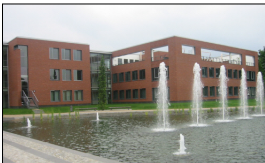
Einer der Neubauten des Hasso-Plattner-Institutes

Im Jahr 2000 wurde der Grundstein zu einem wichtigen Neubau auf dem ehemaligen DRK-Gelände gelegt, das den Babelsberger Wissenschaftsstandort in der Zukunft bedeutsam prägen wird: Hasso Plattner gründete das nach ihm benannte Institut für Softwaresystemtechnik, in dem Studierende zu Software-spezialist(inn)en ausgebildet werden.